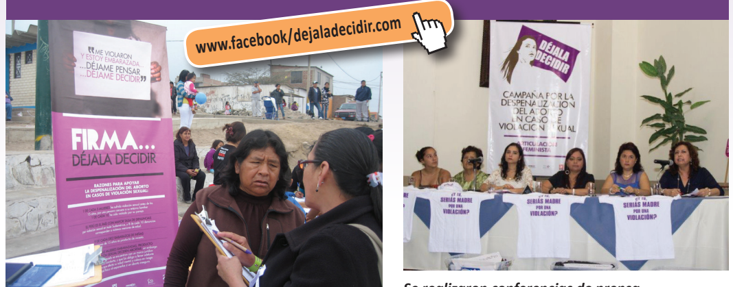
Movilización nacional de diversas organizaciones de mujeres y hombres para la recolección de firmas.

La Articulación Feminista está conformada por las organizaciones Movimiento Manuela Ramos, Demus – Estudio para la Defensa de los Derechos de la Mujer, PROMSEX, Centro de la Mujer Peruana Flora Tristán, Católicas por el Derecho a Decidir y CLADEM Perú. Este colectivo impulsa y conduce la campaña nacional para lograr la despenalización del aborto en casos de embarazos a consecuencia de una violación sexual, inseminación artificial o transferencia de óvulos no consentida; mediante la aplicación del mecanismo constitucional denominada iniciativa legislativa ciudadana.