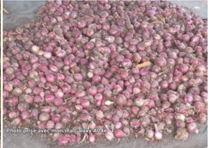
*Cosecha de cebollas en Soudouweli (foto superior)