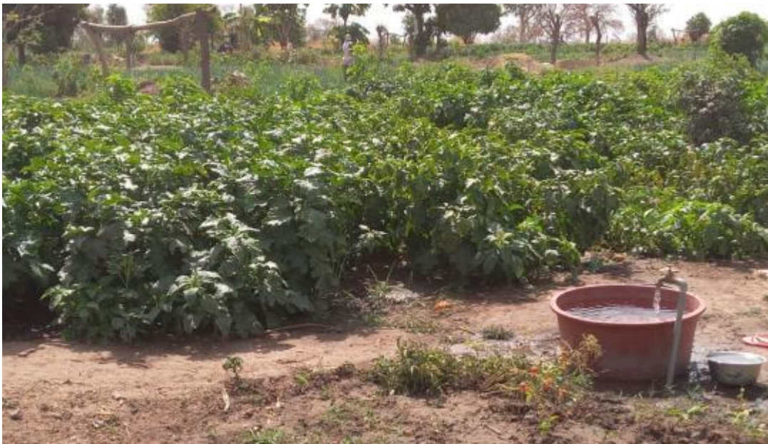
* Dada la situación de la huerta perimetral con diversificación de la producción en el Niaming (foto superior e inferior)