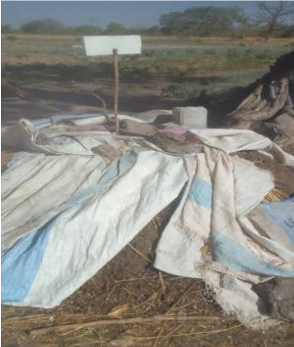
* Un montón de compost listo para usar en Koel (práctica agroecológica)

Los cultivadores de los 3 huertos de Koel, Niaming y Soudouwéli han recibido formación en técnicas ecológicas para mejorar la fertilidad del suelo, proteger los cultivos de plagas y animales y mejorar la producción, para aprovechar al máximo el año, sin prácticas intensivas ni productos químicos.