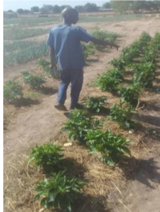
* Vista del acolchado en los chiles (práctica agroecológica)