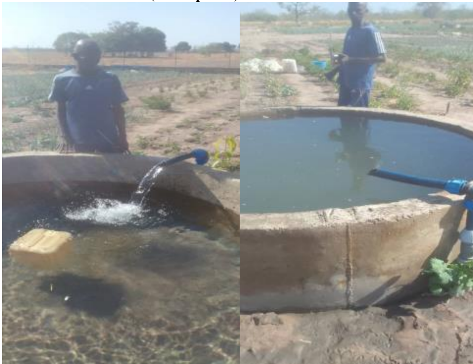
*Vista de los estanques creados por el proyecto Koel (foto superior)