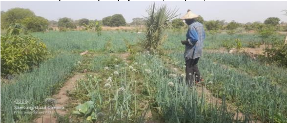
*Intervención en la huerta de Niaming