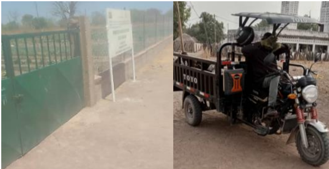
* Vista de la nueva valla perimetral y de un triciclo donado por el proyecto

Para hacer operativos los distintos perímetros de las aldeas beneficiarias, se ha construido la red de extracción de agua y de riego en Koel, donde se ha colocado una nueva valla, y se ha instalado un sistema de minidrenaje con bomba solar en Soudouweli.