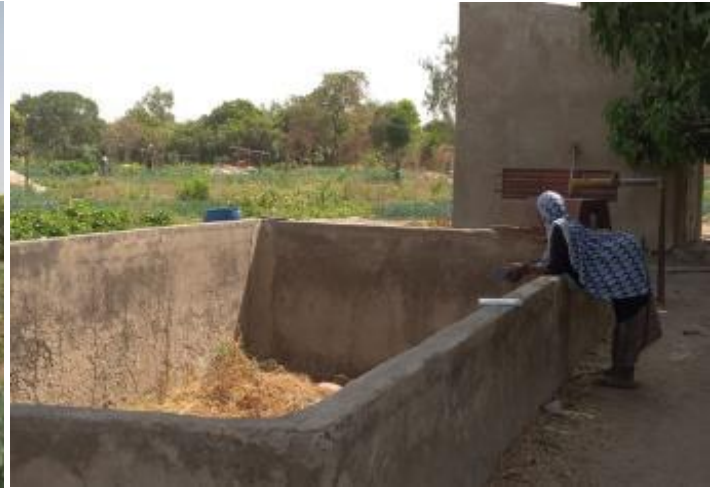
*Prácticas agroecológicas pueden verse en los diversos campos visitados (fotos arriba y abajo).